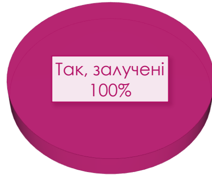
Рис. 3. Розподіл респондентів за залученістю до студентської науково-дослідної роботи