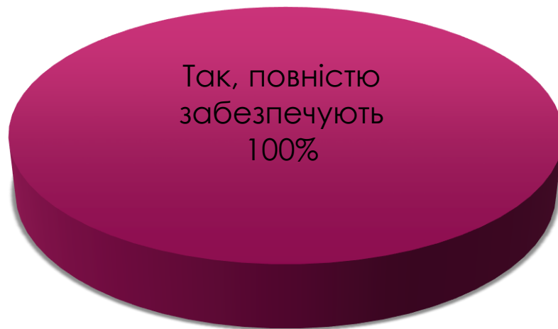
Рис. 2. Розподіл респондентів за відповіддю на запитання: «Чи забезпечують методи навчання, які застосовуються, набуття необхідних Вам компетентностей?»