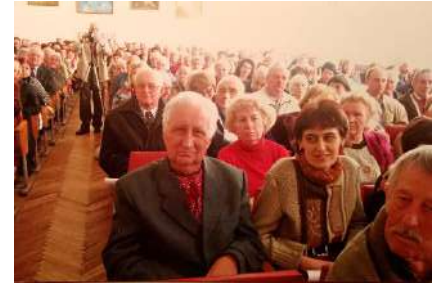
Звітні збори товариства Холмщина в актовому залі Львівської ветеринарного ВИШу, 2010 рік.