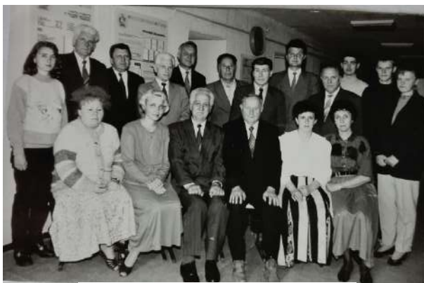
Міжнародні збори провідних зоогігієністів на кафедрі гігієни тварин Львівської державної академії ветеринарної медицини.