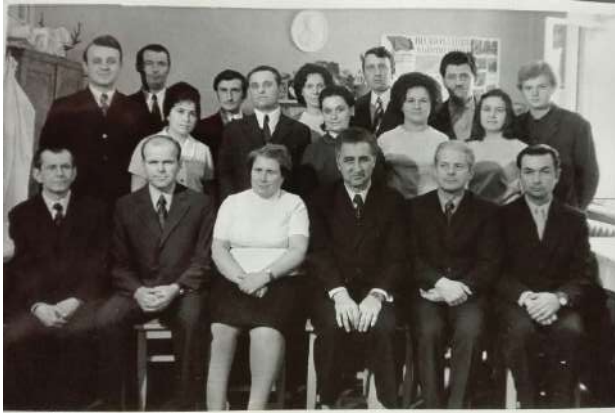
Кафедра гігієни тварин Львівського зооветеринарного інституту, 70-ті роки XX століття

зоогігієнічну оцінку основних систем утримання різних вікових і продуктивних груп тварин. На основі одержаних експериментальних даних були внесені доповнення і поправки до зоогігієнічних нормативів утримання (ВНТП). Модифікував ряд зоогігієнічних, фізіологічних і клінічних методів дослідження.