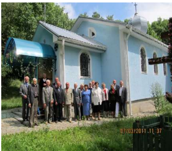
Товариство Холмщина на території української автокефальної православної церкви Холмської ікони Божої Матері, м. Львів, 2011 рік.