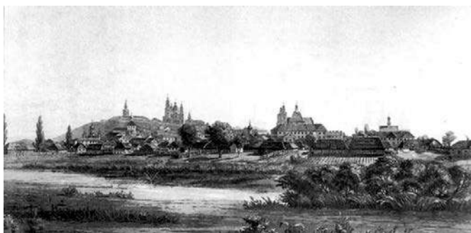
Місто Холм – повітове місто Люблінського воєводства у Польщі. Історична столиця Холмщини.

Збирання до м. Холма для мене завжди було подією. Вражало все: і