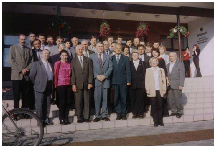
Учасники Міжнародної конференції у одному з польських аграрних вузів.

23 кандидатських дисертацій, діяла аспірантура і магістратура. Зроблено багато для того, щоб Львівську школу гігієністів було визнано в Україні, Росії, Польщі, Чехії, Німеччині, Болгарії, Угорщині, Великої Британії, США та в інших країнах. Понад 30 років був членом Міжнародного товариства зоогієністів (ISAH), до