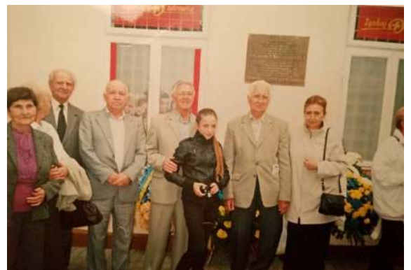
Перед будинком в якому народився Грушевський, м. Холм, 2011 рік

Добре запам'ятав його з часу проведення Першого Світового Конгресу Українців Холмщини і Підляшшя, який відбувався у двох княжих столицях – Львові та Холмі (17-21.09.1994р.). Це була одна з найважливіших широкомасштабних акцій, яку організувало наше товариство. На конгрес прибуло понад 700 делегатів з України, Польщі, Німеччини і США. Михайло Васильович був безпосередньо задіяний в організації і проведенні цього заходу. Перед залю засідань (актова зала Львівської політехніки) діяла багата етнографічна і цікава тематична фотовиставка. Частина експонатів на цій виставці були з колекції Михайла Васильовича.