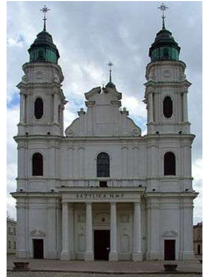
Холмський собор Рівдя Пресвятої Богородиці